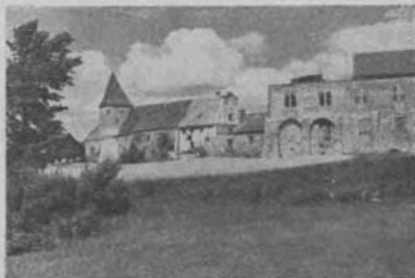
Fragment opactwa Sulejowskiego. W budynku z tzw. szczytem barokowym mieści się muzeum PTK.