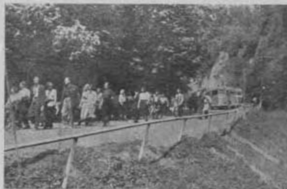
Masowa wycieczka Oddziału Katowickiego w Ojcowie.

Dla przykładu podamy, że pod protektorem Komisarza Rządu do walki z analfabetyzmem na zakończenie roku szkolnego 1949/50 zorganizowano wycieczkę uczestników kursów dla analfabetów z Częstochowy do Warszawy (575 uczestników), 700 kursistów wzięło udział w wycieczce z Krakowa do Katowic, 500 uczestników, kończących kursy dla analfabetów wyjechało z Rzeszowa do Krakowa. Uczestników tych wycieczek podejmowały Oddziały P.T.K. w War-