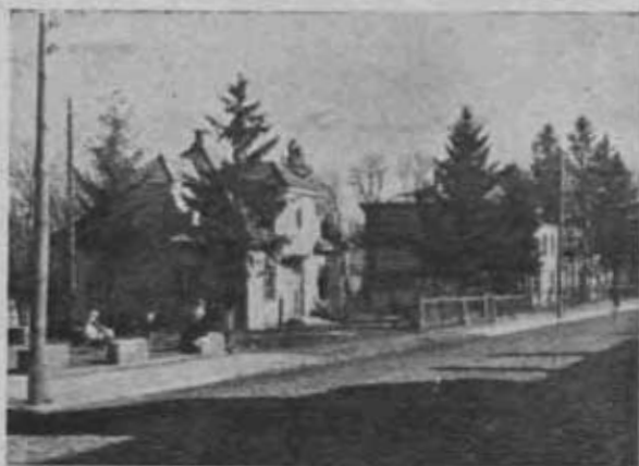
Obiekty PTK w Sandomierzu: 1-y Muzeum.

Zarząd Główny P.T.K. nie posiada kompletnych danych, dotyczących ilości noclegów, wykorzystanych w roku 1950 w schro-