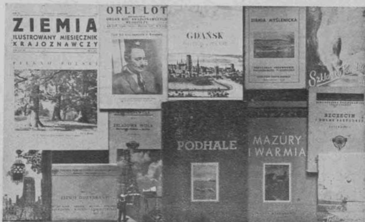
Typy wydawnictw P.T.K.

Przygotowano do druku również — Paczków — przewodnik krajoznawczy, objętość 32 str.