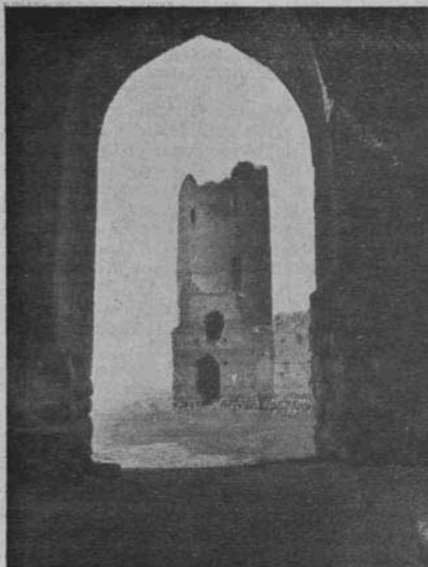
Zamek w Cziersku pod opieką P.T.K.