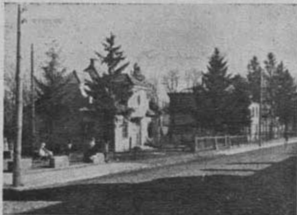
Obiekty PTK w Sandomierzu: 1-y Muzeum.

Zarząd Główny P.T.K. nie posiada kompletnych danych, dotyczących ilości noclegów, wykorzystanych w roku 1950 w schro-