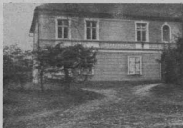
Schronisko PTK w Fromborgu.

Szczególną frekwencją cieszyły się schroniska P.T.K. na Warmii i Mazurach, oraz na