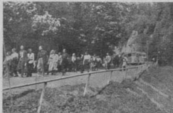
Masowa wycieczka Oddziału Katowickiego w Ojcowie.

Dla przykładu podamy, że pod protektorem Komisarza Rządu do walki z analfabetyzmem na zakończenie roku szkolnego 1949/50 zorganizowano wycieczkę uczestników kursów dla analfabetów z Częstochowy do Warszawy (575 uczestników), 700 kursistów wzięło udział w wycieczce z Krakowa do Katowic, 500 uczestników, kończących kursy dla analfabetów wyjechało z Rzeszowa do Krakowa. Uczestników tych wycieczek podejmowały Oddziały P.T.K. w War-