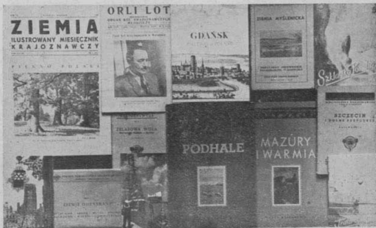
Typy wydawnictw PTK.

Przygotowano do druku również — Paczków — przewodnik krajoznawczy, objętość 32 str.