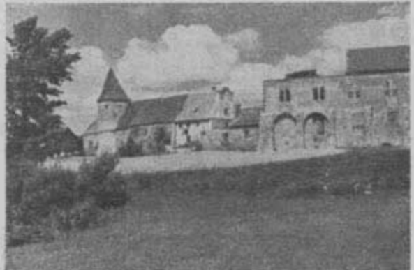
Fragment opactwa Sulejowskiego. W budynku z tzw. szczytem barokowym mieści się muzeum PTK.